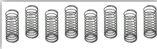
Slot-it CH55B Medio largo: