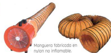
Manguera fabricada en nylon no inflamable.