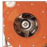
Turbina curvada Garantiza ahorro de energía y trabajos de bajo nivel sonoro.