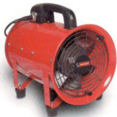
MV200/MV300. Con asa y 4 pies de goma.