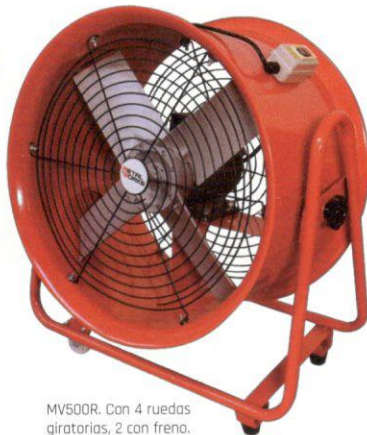
MV500R. Con 4 ruedas giratorias, 2 con freno.