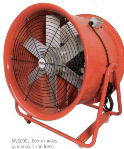
MV600SL. Con 4 ruedas giratorias, 2 con freno.