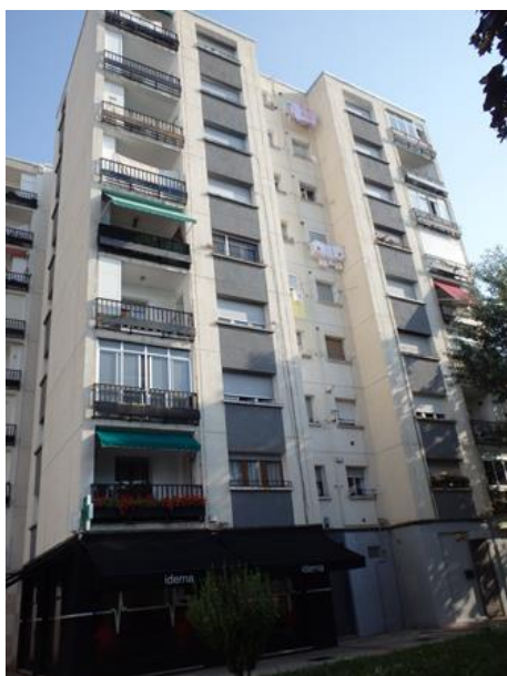
Edificio C/Valtierra, 21 antes de la rehabilitación