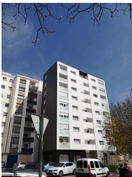
Edificio C/Valtierra, 21 después de la rehabilitación

Para la financiación de la actuación NASUVINSA gestionó un acuerdo marco con una entidad bancaria, que financió el 100% del coste antes del inicio de las obras, a través de dos préstamos, el primero por el importe de la parte subvencionada, que se cancela cuando se reciben las subvenciones, y el segundo por el importe de la parte no subvencionada a pagar en 12 años.