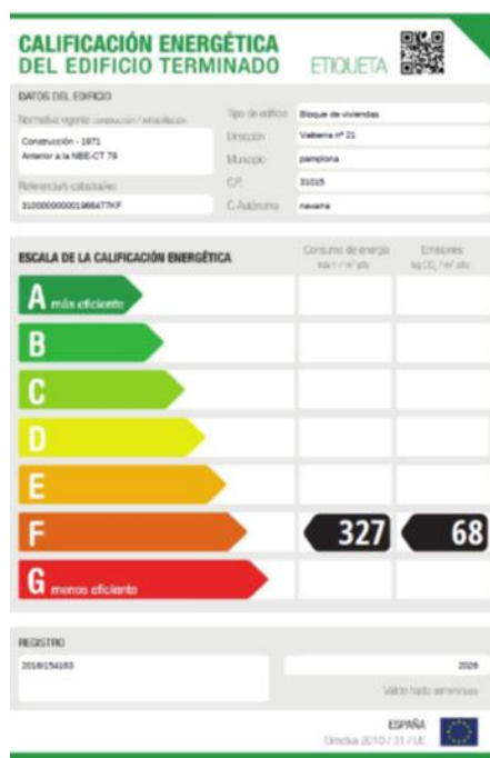
Calificación energética del edificio antes de la rehabilitación

Se han eliminado los puentes térmicos aislando los frentes de los forjados, las losas de balcones en contacto con el aire exterior y los petos de remate de la cubierta.