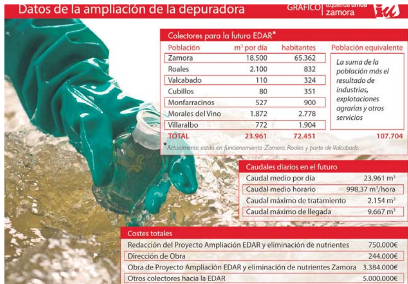
Gráfico de Miguel Ángel Viñas, concejal de IU

El coste actual de explotación de la EDAR (gestión privatizada desde su construcción en 2004) es de 2.700.000 €, que paga el Ayunta-