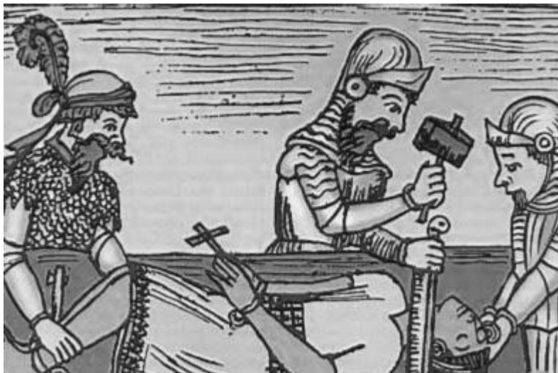
Ilustración adaptada del original del cronista Guamán Poma de Ayala que decía "Córtale la cabeza a Atahualpa"

- ¿Cuáles fueron las causas de que la población indígena fuera devastada por los conquistadores europeos? Desarrollar.