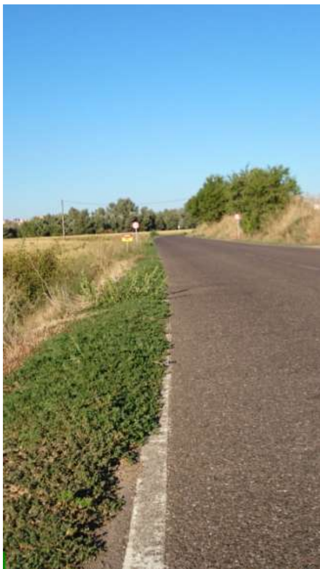
Km.2, Entre bajada Cuesta de los Alamillos y contenedores