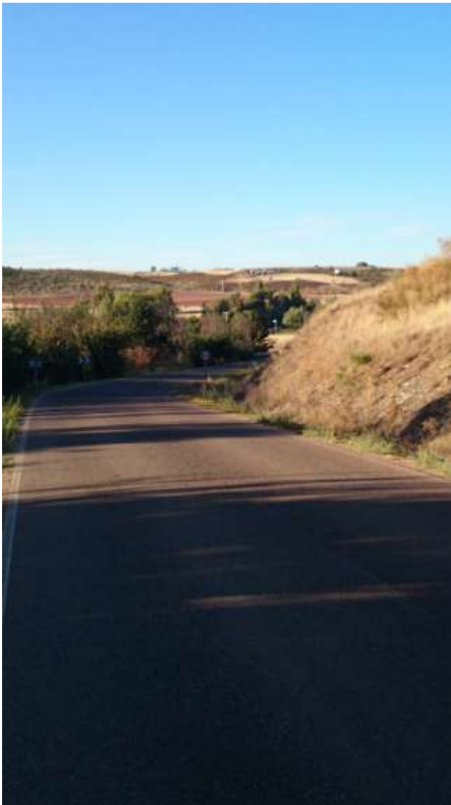
Km. 4.900, Entrada al Barrio, líneas desaparecidas