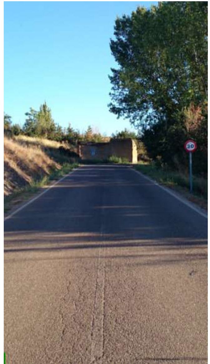
Km. 5. Entrada al Barrio