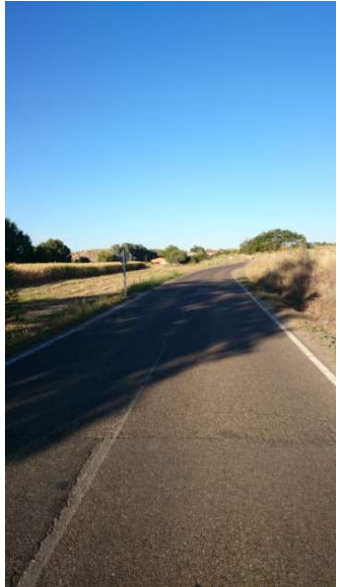
Km. 3,900, Proximidades antiguo restaurante La Casita