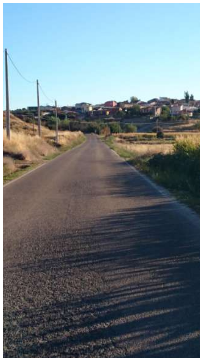
Km. 4,600. Proximidades del Barrio, líneas desaparecidas