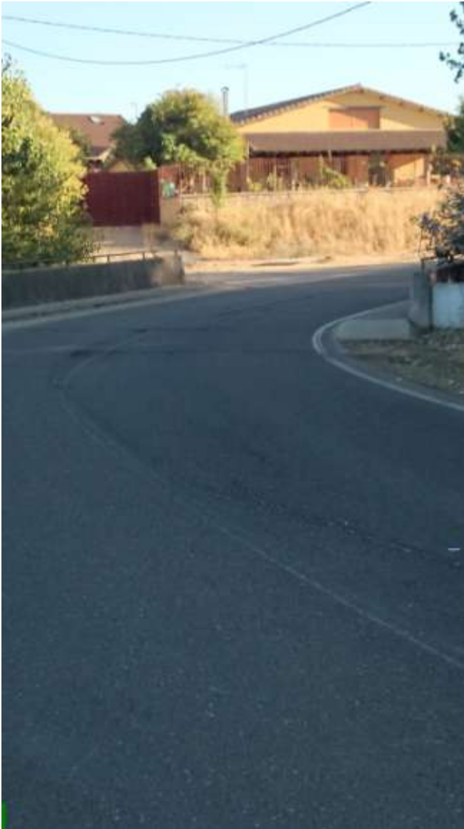
Km. 4. Curva puente Regato del Zape