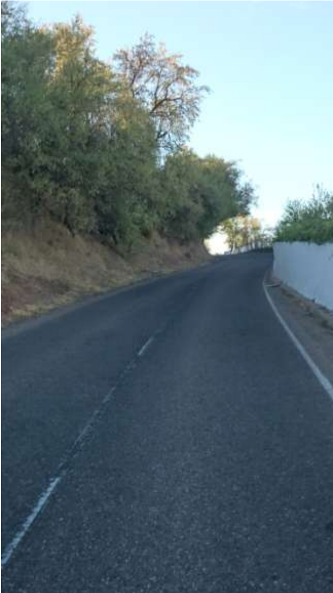
Km. 1,100. Subida Cuesta de los Alamillos