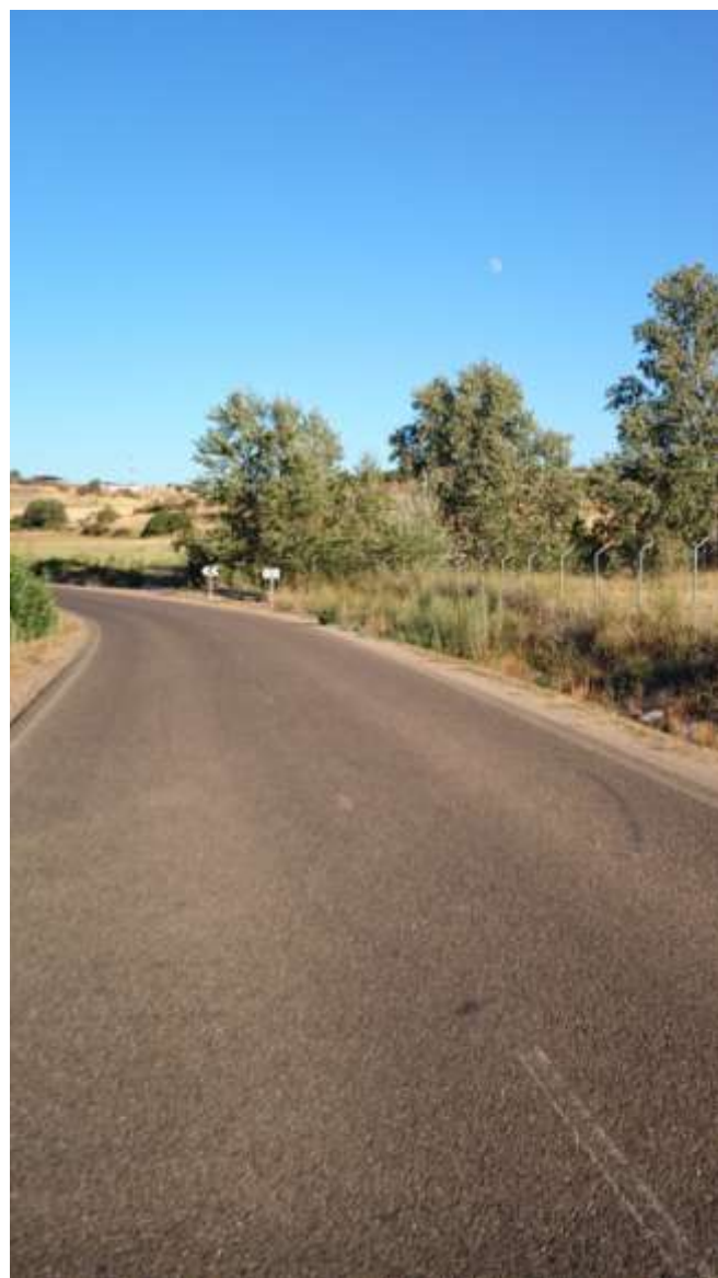
Km.2.300, Puesto de los contenedores en la carretera