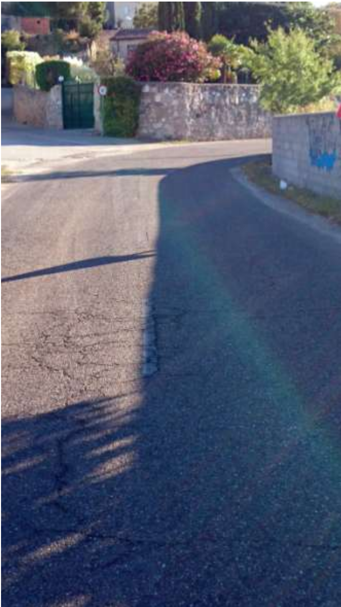
Km. 0. Salida Puente de los Poetas. Inicio Crtra. de Carrascal