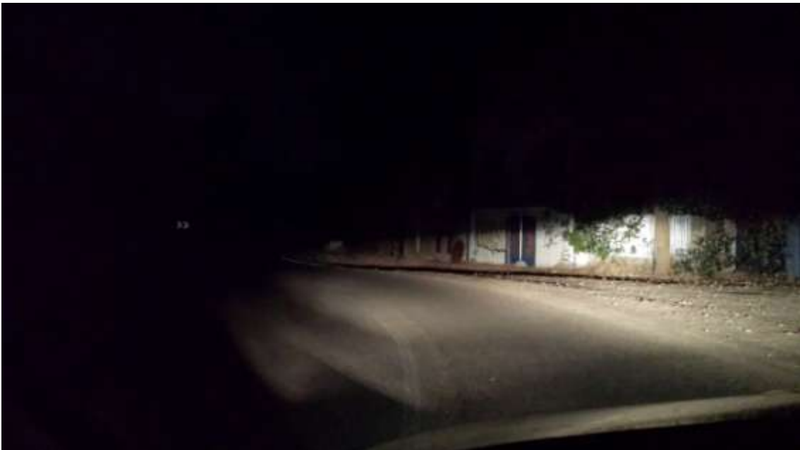
Km.4. Curva antiguo restaurante La Casita