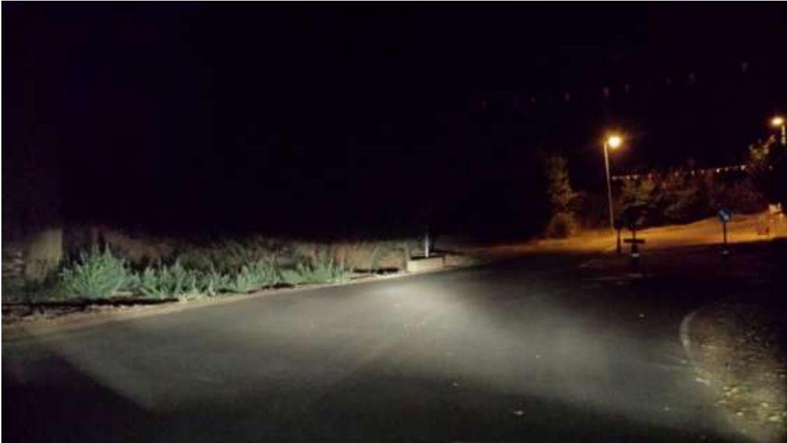
Km. 5. Entrada en el Barrio.