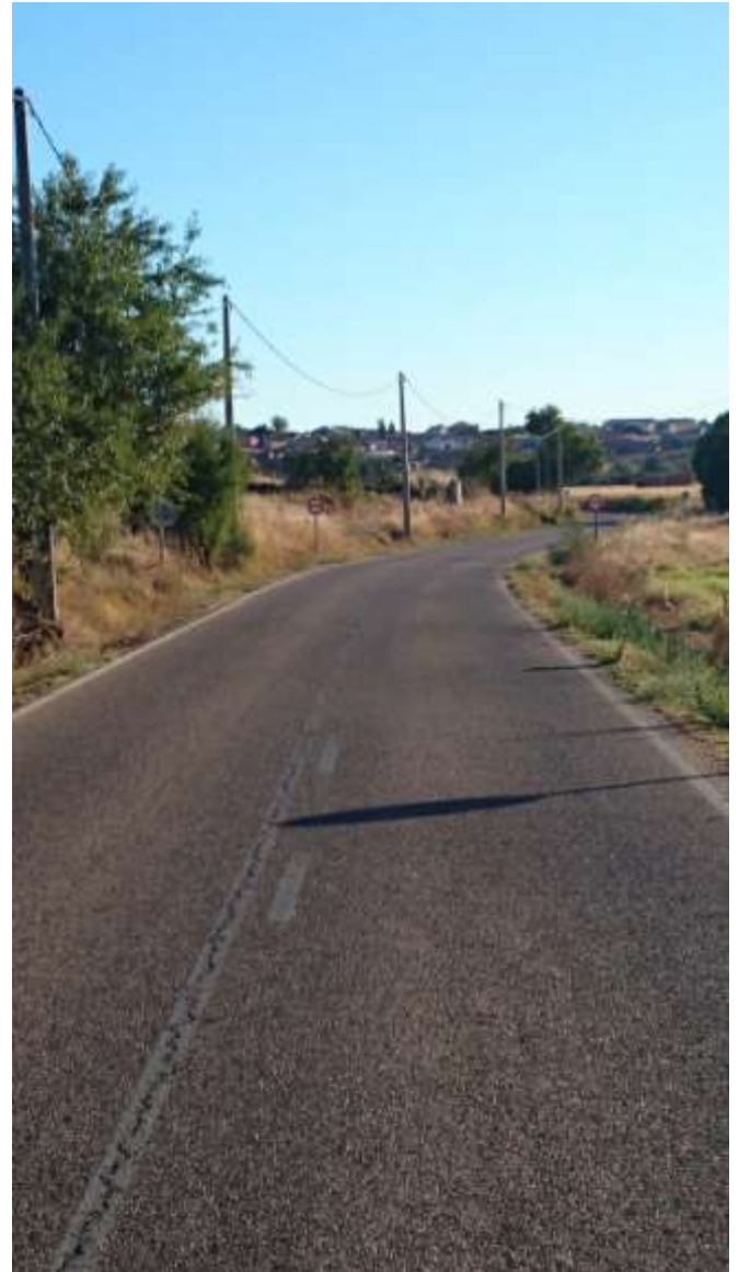
Km. 4,100. Salida doble curva.