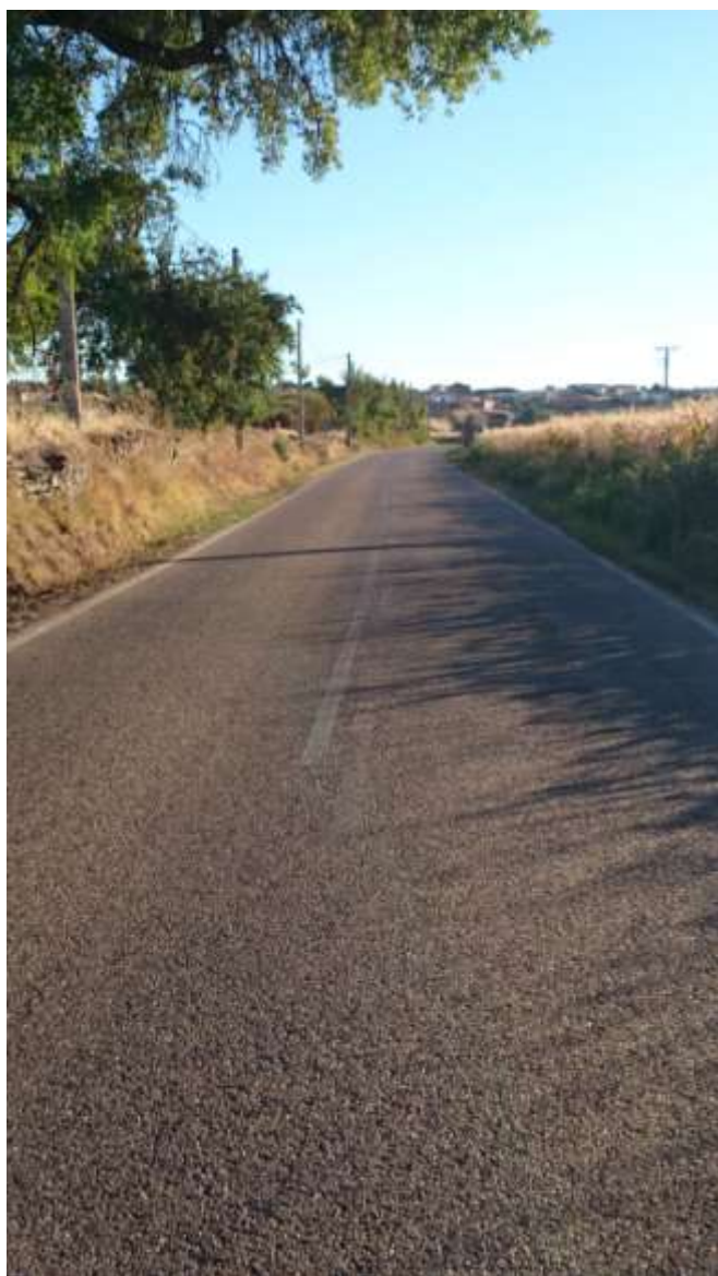
Km. 4,300 El Reguero