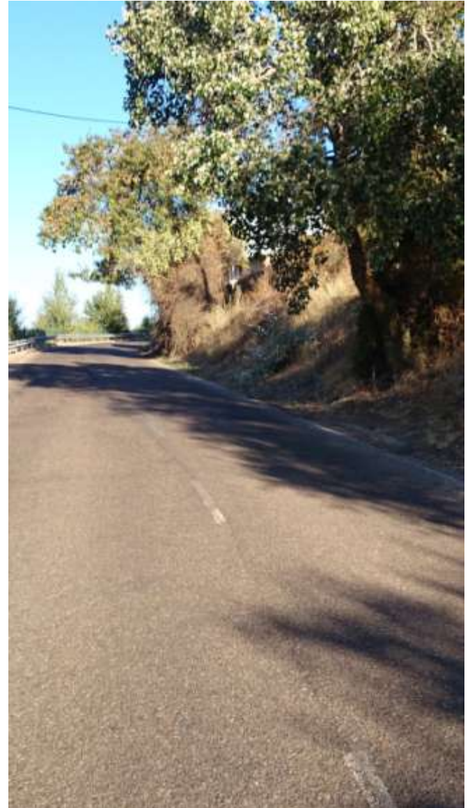
Km. 1.300. Bajada Cuesta de Los Alamillos