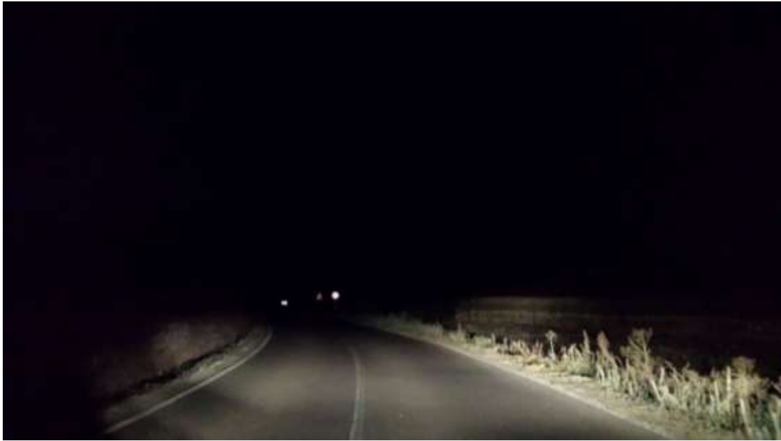
Km. 4.100. Salida doble curva antiguo restaurante la Casita