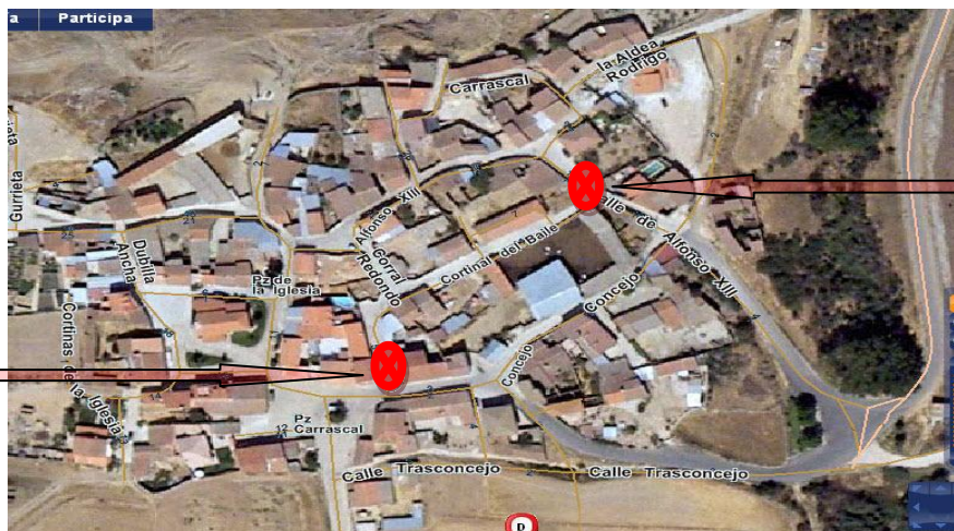
Cruce c/Corral Redondo-c/Concejo

Para el acceso a esas salidas se hace necesario atravesar dos cruces de nula visibilidad en los que es necesario invadir a ciegas el carril de la vía que se cruza con la parte delantera de los vehículos, hasta que el conductor consigue visibilidad, con el consiguiente peligro de colisión, agravado por el circular de maquinaria agrícola que necesita aún más espacio para poder conseguir esa visión.