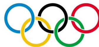
Drapeau des Jeux Olympiques

langue officielle des Jeux Olympiques et, avec le latin, la langue diplomatique du Vatican. Sans oublier que les trois capitales de l'Union européenne : Bruxelles, Luxembourg et Strasbourg sont francophones.